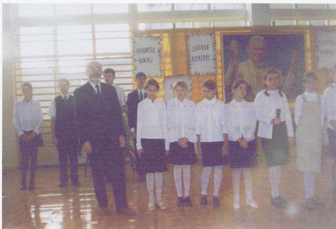
Akademia z okazji 25 rocznicy pontyfikatu papieża Jana Pawła II – go.

W połowie miesiąca października uczciliśmy 25 rocznicę wyboru na Stolicę Piotrową Polaka, papieża Jana Pawła II. W niedzielę poprzedzającą rocznicę wyboru w całym polskim kościele zbierane były ofiary na fundusz papieski, fundusz stypendialny dla młodzieży zdolnej, ale będącej w trudnej sytuacji materialnej. O godz. 21 – szej zorganizowaliśmy apel jasnogórski ze świecami. W samą rocznicę 25 – lecia w miejscowej Szkole Podstawowej odbyła się uroczysta akademia dedykowana papieżowi. Program artystyczny z tej akademii został powtórzony tego dnia w kościele podczas wieczornego nabożeństwa.